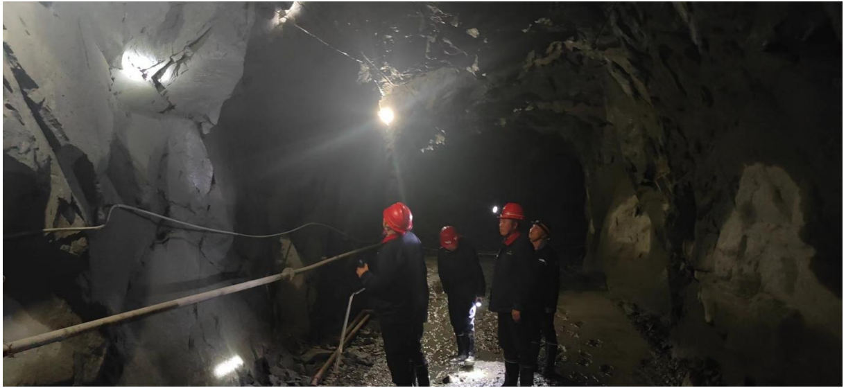
图 1 现场勘查照片