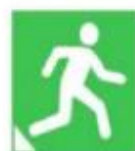
室外型应急避难场所