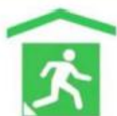
室内型应急避难场所